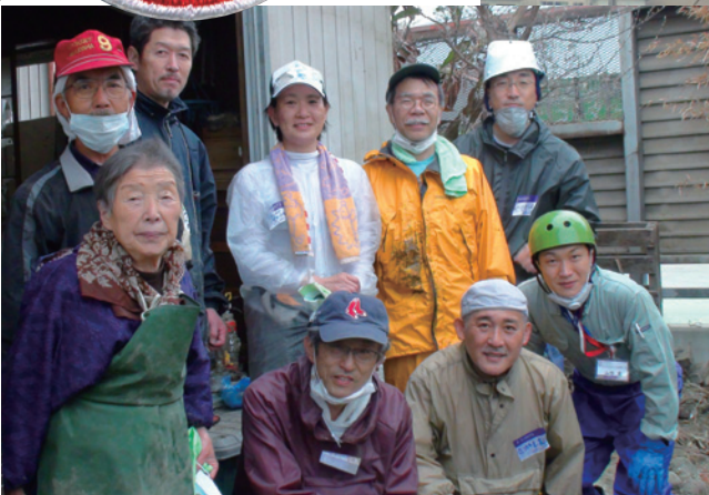
1階天井ギリギリまで津波に襲われながら九死に一生を得た90歳のおばあちゃん。救助されるまで2日間ひとり耐えたそうです。

都窪オリジナル 支援ワッペン一枚 1000円を全額寄付 (5/6現在 86,000円)