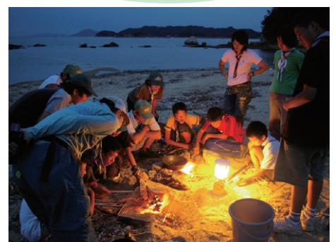
無人島サバイバル