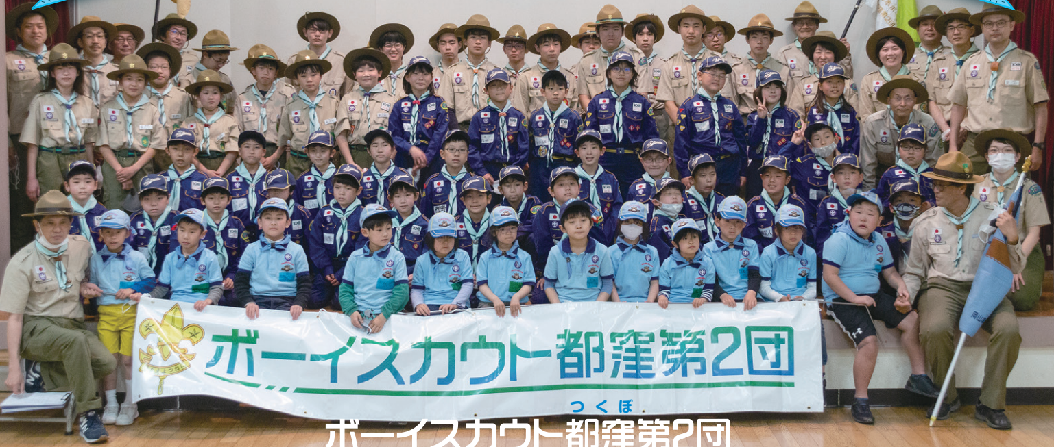
ボーイスカウト都窪第2団